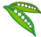
Zielony Gro- szek